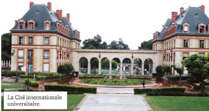
La Cité internationale universitaire.