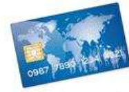
carte de crédit