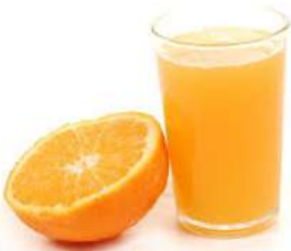
un jus d'orange