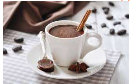
un chocolat chaud