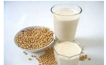
du lait de soja