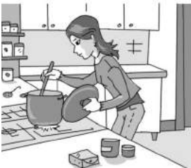
5. Martine .....