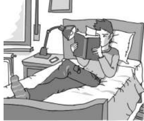
6. Théo .....