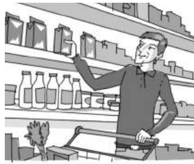
4. Papa .....