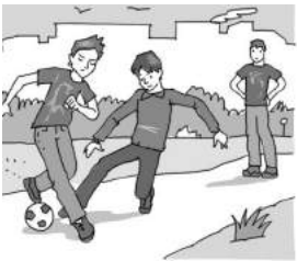
3. Les enfants .....