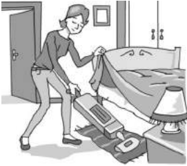
1. Maman .....