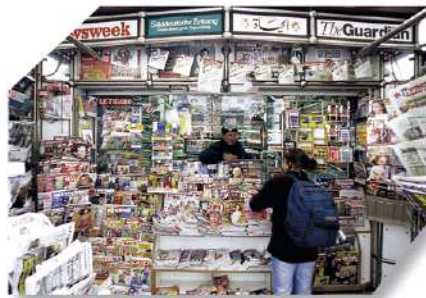
... la presse et les médias ● Épisode 5