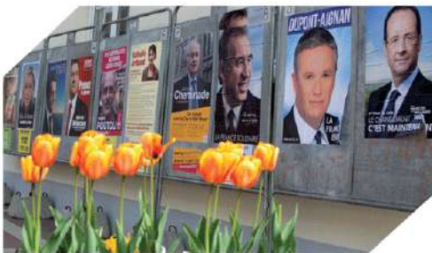
... l'organisation administrative et politique du pays ● Épisodes 3 et 4