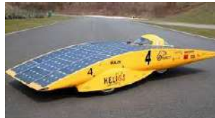
une voiture solaire