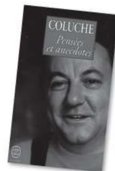
Coluche, Pensées et Anecdotes , Le Livre de Poche n° 14382.