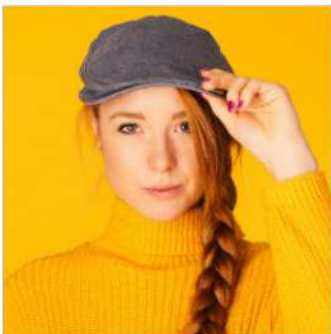
Le TOP 5 des étudiants

Faites le TOP 5 des loisirs pour chaque type de personne.