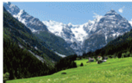
à la montagne