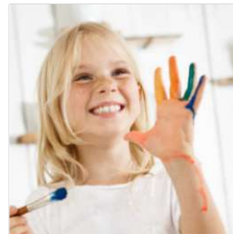
Le TOP 5 des enfants