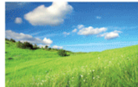
à la campagne