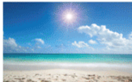
à la mer