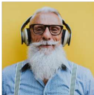
Le TOP 5 des retraités