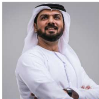
Le TOP 5 des riches