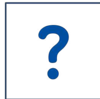
MON TOP 5