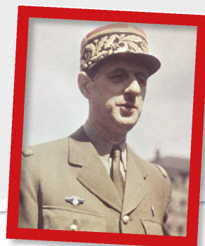
Charles de Gaulle