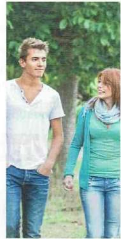
• se promener