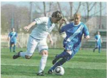
• jouer au foot