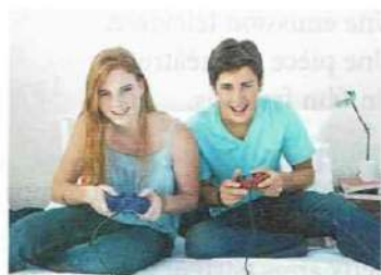
• jouer aux jeux vidéo