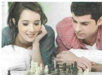
• jouer aux échecs