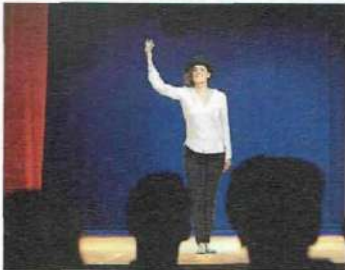
• faire du théâtre