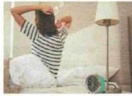
• se lever