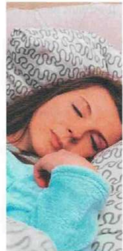
• se coucher