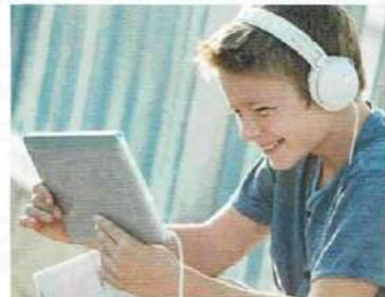
• écouter de la musique