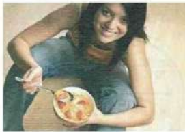
• prendre son petit-déjeuner