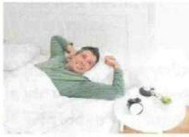
• se réveiller