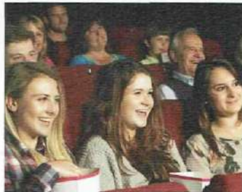
• aller au cinéma