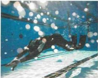
• aller à la piscine