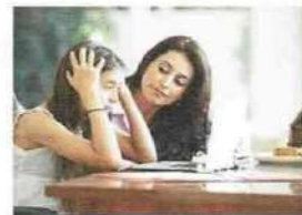
• faire ses devoirs