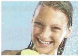
• se doucher