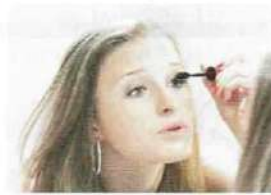
• se maquiller