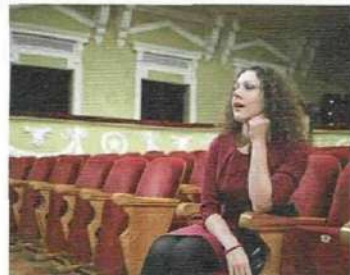
• aller au théâtre