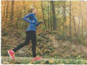
• pratiquer une activité / un sport