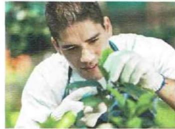
• faire du jardinage