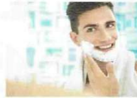
• se raser