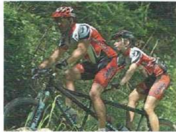
• faire du VTT