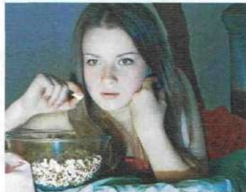
• regarder la télé(vision) / un film